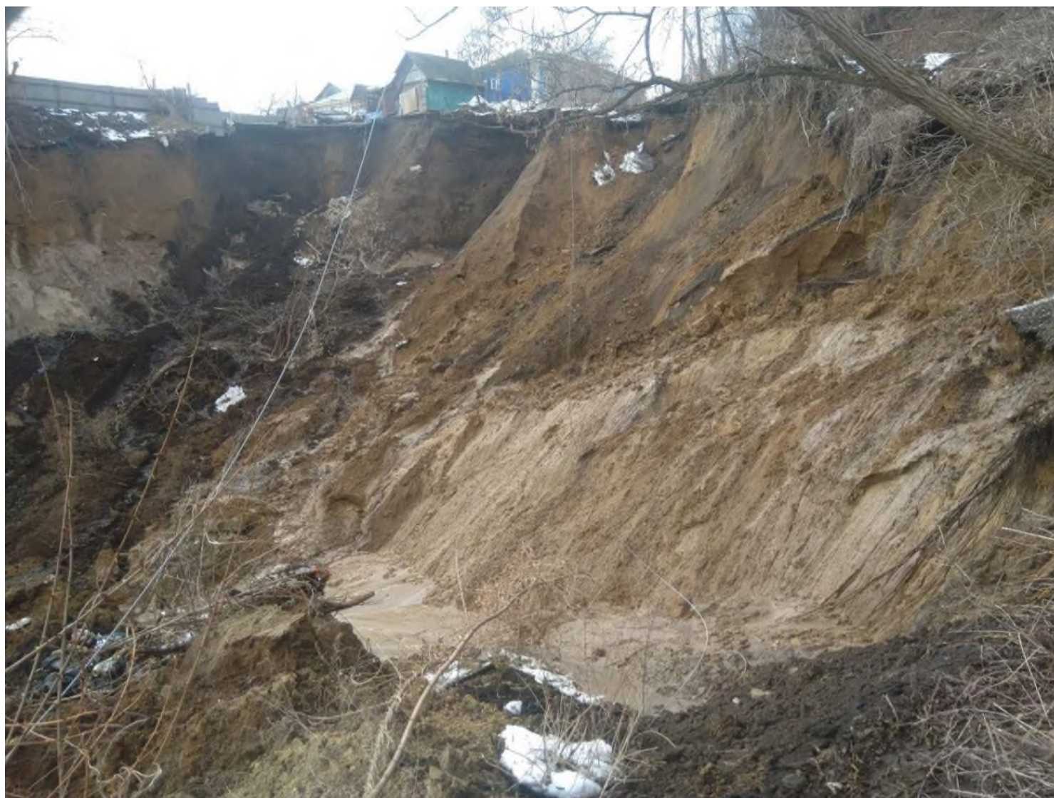
Фото 36-11-00541 Активный оползень в г. Новохоперск, Воронежской области