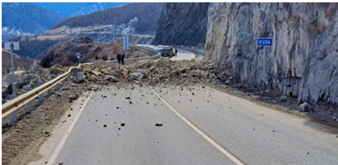
Фото 04-10-00004. Уч. а/дороги Р-256 Чуйский тракт, 686 км. Глыбы перекрыли автодорогу Р-256 на отрезке 10 м, Онгудайский район, Республика Алтай, 27.03.2024