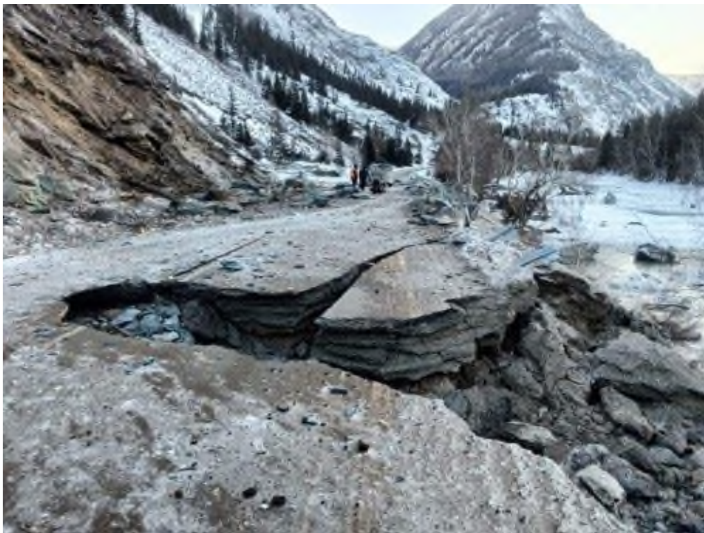
Фото 04-10-00005. Уч. а/дороги Р-256 Чуйский тракт, 764,525-764,86 км. Разрушение дороги, Онгудайский район, Республика Алтай, 19.01.2024