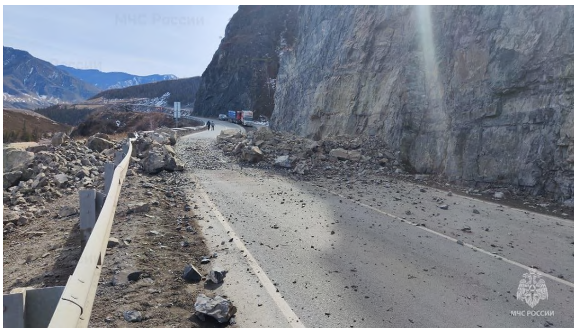
Фото 04-10-00004. Уч. а/дороги Р-256 Чуйский тракт, 686 км. Дорога на отрезке 10 м частично расчищена для пропуска транспорта, Онгудайский район, Республика Алтай, 27.03.2024