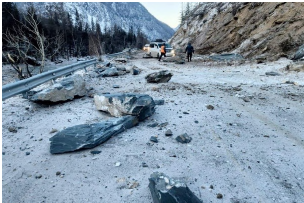
Фото 04-10-00005. Уч. а/дороги Р-256 Чуйский тракт, 764,525-764,86 км. Глыбы на дорожном полотни, Онгудайский район, Республика Алтай, 19.01.2024