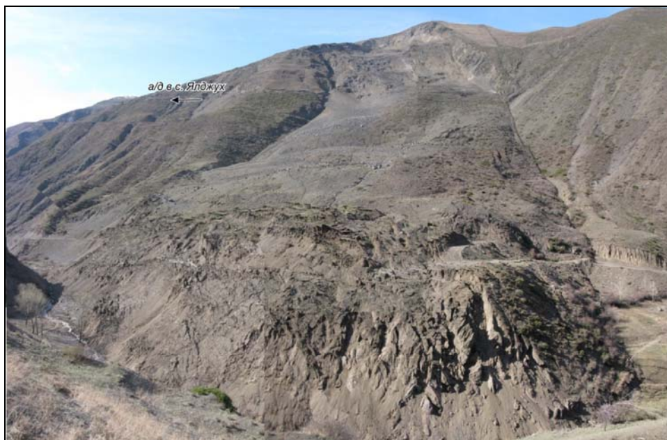
Рис.3. Катастрофический оползень в окрестностях с. Куркал.

Поверхность оползневого тела покрыта многочисленными трещинами (рис.4) шириной раскрытия от 0,5м до 3-5м, глубиной от 1,0 до 3,0м и более.