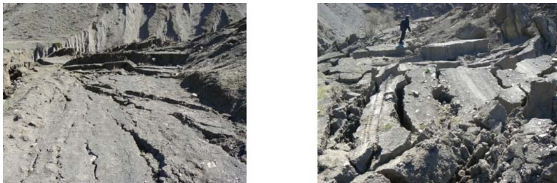
Рис.5. Фрагменты разрушенного полотна автодороги Ахты – Ялджух.

В результате катастрофической активизации оползневой процесс разрушено около 1,5 км автодороги, связывающей районный центр с.Ахты с сс. Ялджух и Ухул (рис.5). В языковой части оползня выведено из оборота около 3,0 га сенокосных угодий. Разрушенная автодорога в населенные пункты Ялджух и Ухул восстановлению не подлежит.