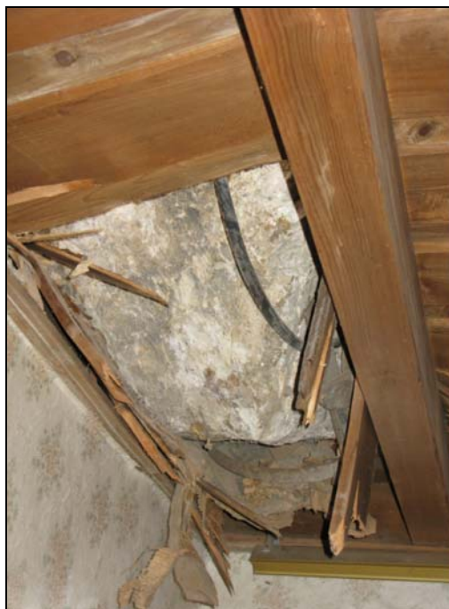
Рис.1. Глыба известняка, пробившая крышу здания.

Обвалоопасный склон протягивается на 400-600 м вдоль северо-восточной окраины села и расположен в 100 м от границы застройки. Объем глыб известняков, достигших территории села, составил около 300 м 3 . При этом частично разрушены 3 домостроения и хозяйственные постройки (рис.1). Часть глыбово-щебнистого материала была задержана деревьями на окраине с. Голотль.