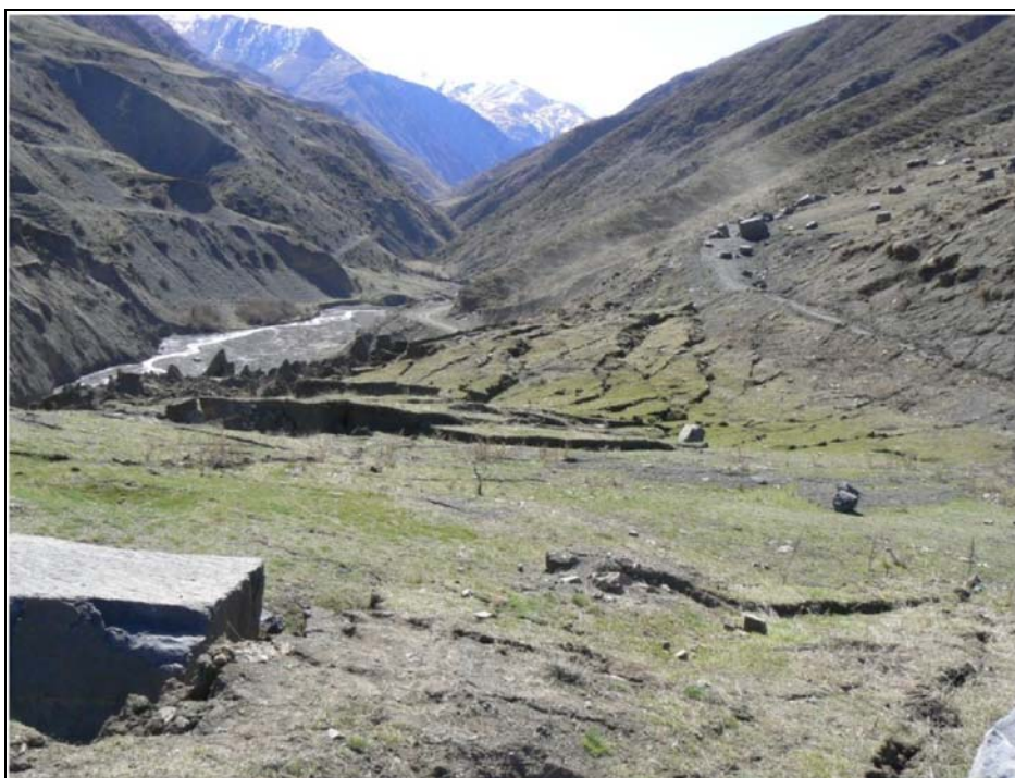
Рис.4. Трещины на поверхности оползневого тела (ГУП РЦ «Дагестангеомониторинг»).

Поверхность оползневого тела покрыта многочисленными трещинами (рис.4) шириной раскрытия от 0,5м до 3-5м, глубиной от 1,0 до 3,0м и более.