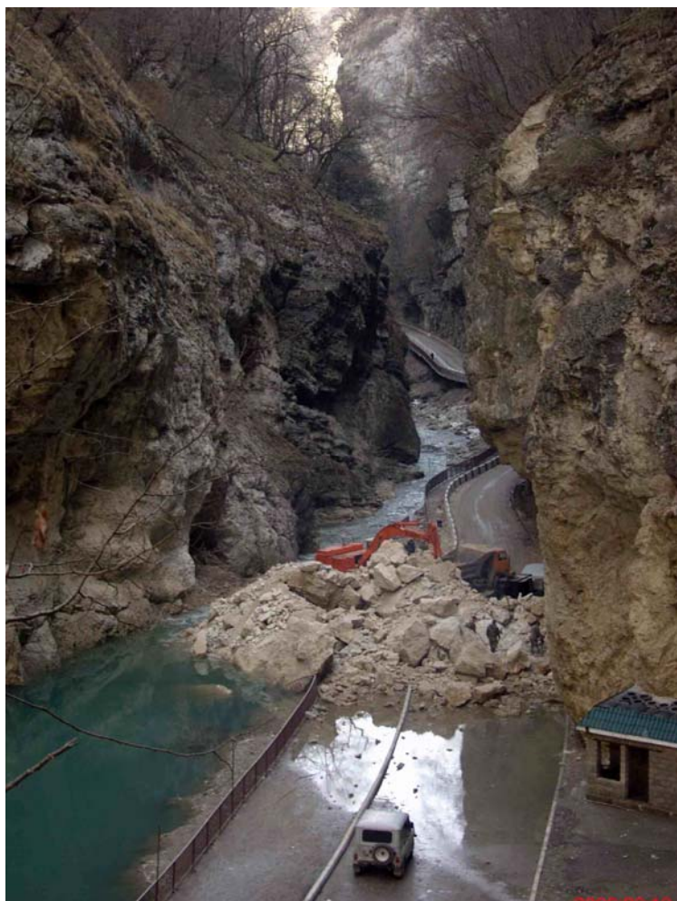
Рис.6. Обвал, перекрывший автодорогу Чегем – Верхний Чегем и русло р. Чегем (ГП КБР ТЦ «Каббалкгеомониторинг»).

Обвал скальных пород в районе с. Хушто-Сырт Чегемского района Кабардино-Балкарской Республики 26 января 2009 г. около 20 часов в правом борту долины р. Чегем, в 0,8 км от с. Хушто-Сырт. Обвальные отложения, представленные в основном глыбами известняка объёмом до 25 \text{ м}^3 , образовали сплошной завал, перекрывший автодорогу Чегем – Верхний Чегем на 39 километре и русло р. Чегем, протекающей в узком каньоне (рис.6). Протяженность завала по фронту до 30 м, высота – 15 м. Ширина обвальной ниши 20 м, высота около 40 м, глубина – 8 м. Объём завала порядка 7000 \text{ м}^3 . Выше завала образовалось подпрудное озеро, размерами около 120 \times 45 \times 7,5 \text{ м} , объём воды в озере оценивался в 40500 \text{ м}^3 .